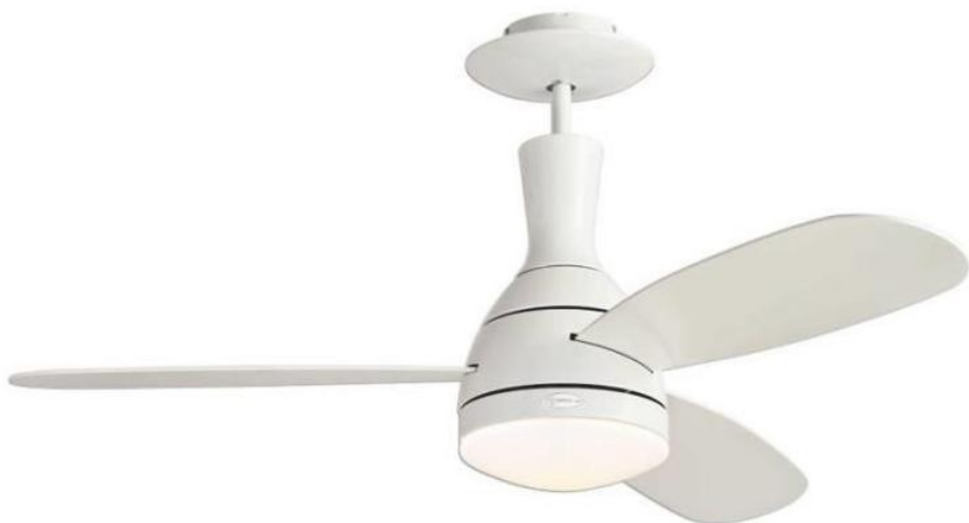
WESTINGHOUSE Cumulus 72598